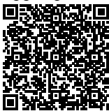
DEWI NAYATI Ketua TUK